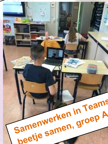
Samenwerken in Teams, toch beetje samen, groep A en B

Naast de standaard schoonmaakmiddelen ziet u een desinfecteerstation met middelen voor de schoonmaak en handgel (wordt maar minimaal gebruikt: we geven de voorkeur aan water en zeep), een kuscherm tussen leerkracht en leerling, kinderen desinfecteren hun tafel en de Ipad of laptops. In de onderbouw doen de leerkrachten, onderwijsassistent of schoonmaakster dat!