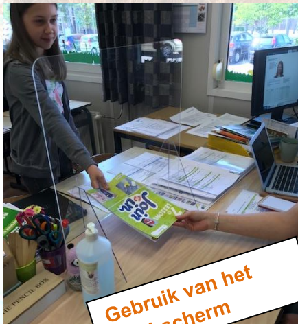
Gebruik van het Kuchscherm