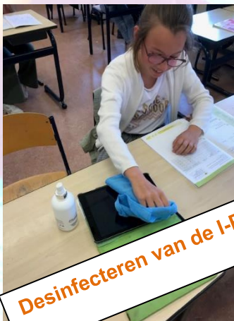
Desinfecteren van de I-Pad